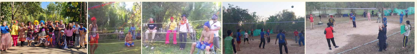
มวยคู่พิเศษ ตี E35 VS อ.เก่ง

ความสุขของชาวอโรยาศา สถานที่ที่มีแต่การให้ภายใต้สโลแกน “อยู่สบาย ตายสงบ งบประมาณไม่เสีย “หรือ” โรงพยาบาลที่มีความสุขที่สุดในโลก” คือ สถานชีวภิบาลต้นแบบแห่งแรกของประเทศไทย อโรยาศาล วัดคำประมง จังหวัดสกลนคร แห่งนี้