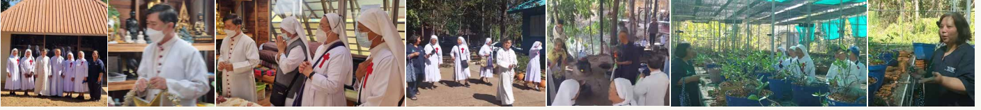
ประมุขอัครสังฆมณฑลท่าแร่-หนองแสงและคณะกรรบานมัสการหลวงตาและมอบของขวัญปีใหม่ ๒๕๖๙ แก่ผู้ป่วยมะเร็งพร้อมเยี่ยมชมโรงเรือนหัวร้อยรู