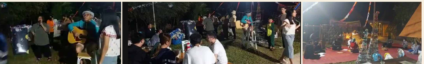
งานส่งท้ายปีเก่า ๒๕๖๘ ต้อนรับปีใหม่ ๒๕๖๙ ชาวอโรยาศา