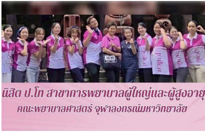
นิสิต ป.โท สาขาการพยาบาลผู้ใหญ่และผู้สูงอายุ คณะพยาบาลศาสตร์ จุฬาลงกรณ์มหาวิทยาลัย

คณะพยาบาลศาสตร์ จุฬาลงกรณ์มหาวิทยาลัย ส่งนิสิตพยาบาล สาขาการพยาบาลผู้ใหญ่และผู้สูงอายุ หลักสูตรปริญญาโทฝึกปฏิบัติงาน การดูแลผู้ป่วยระยะเรื้อรัง ณ สถานชิวาภิบาล อโรคยศาล วัดคำประมง จังหวัดสกลนคร ระหว่าง ๗ - ๑๒ กันยายน ๒๕๖๘