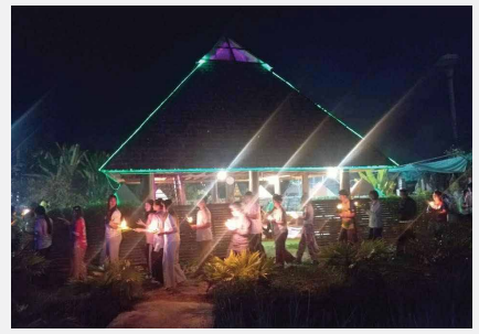
ศิษยานุศิษย์ ผู้ป่วยมะเร็ง ญาติผู้ป่วย และเจ้าหน้าที่ อโรคยศาล วัดคำประมง ร่วมพิธีเวียนเทียนในวันมาฆบูชา ณ ศูนย์ศาลาพระเมตตา อโรคยศาล วัดคำประมง จังหวัดสกลนคร เมื่อ ๑๒ กุมภาพันธ์ ๒๕๖๘