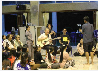
คณะพยาบาลศาสตร์ มหาวิทยาลัยขอนแก่น นำนักศึกษาหลักสูตรผู้ช่วยพยาบาลเป็นจิตอาสาและศึกษาดูงาน ณ สถานชีวภิบาล อโรคยศาล วัดคำประมง จังหวัดสกลนคร เมื่อ ๑๒ - ๑๕ กุมภาพันธ์ ๒๕๖๘