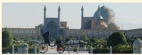
จตุรัส แห่งเมืองIsfahan