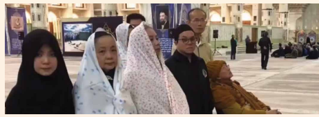
หลวงตาและคณะเยี่ยมชม สุสานผู้นำสูงสุดของอิหร่าน