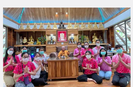
นิสิตปริญญาโท คณะพยาบาลศาสตร์ จุฬาลงกรณ์มหาวิทยาลัย ศึกษาดูงานและเป็นจิตอาสา ณ สถานชีวภิบาล อโรคยศาล วัดคำประมง จังหวัดสกลนคร ระหว่าง ๗-๑๓ สิงหาคม ๒๕๖๗