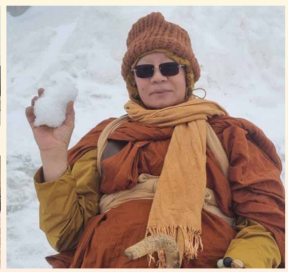
หลวงตาและคณะสัมผัสหิมะที่ Mount Tocha