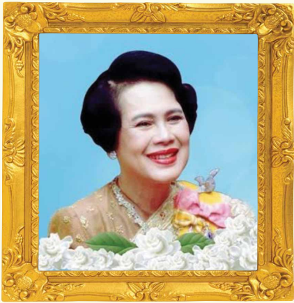
วันแม่แห่งชาติ ๑๒ สิงหาคม ๒๕๖๗