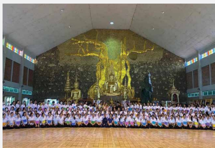
คณะนักศึกษาพยาบาลจากวิทยาลัยบรมราชชนนีนครพนม เข้าศึกษาดูงานและเป็นจิตอาสา ณ สถานชีวภิบาล อโรคยศาล วัดคำประมง จังหวัดสกลนคร ระหว่าง ๑๓ - ๑๔ มิถุนายน ๒๕๖๗