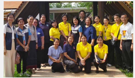
บุคลากรทางการแพทย์ สำนักงานประกันสุขภาพแห่งชาติเขต ๔ ร่วมประชุมผู้เกี่ยวข้อง ๗ จังหวัดเพื่อเชื่อมโยงโครงการมิตรภาพบำบัดในศูนย์ชีวภิบาล ณ สถานชีวภิบาล อโรคยศาล วัดคำประมง จังหวัดสกลนคร ระหว่าง ๓๐-๓๑ พฤษภาคม ๒๕๖๗