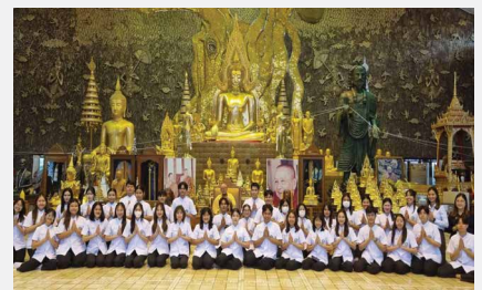
คณะแพทยศาสตร์ มหาวิทยาลัยมหาสารคาม จัดหลักสูตรการแพทย์แผนไทยประยุกต์ สำหรับนิสิตปี ๓ ศึกษาดูงานการดูแลรักษาผู้ป่วยมะเร็งด้วยการแพทย์แผนไทยแบบผสมผสาน ณ สถานชีวภิบาล อโรคยศาล วัดคำประมง จังหวัดสกลนคร เมื่อ ๓๐ สิงหาคม ๒๕๖๗