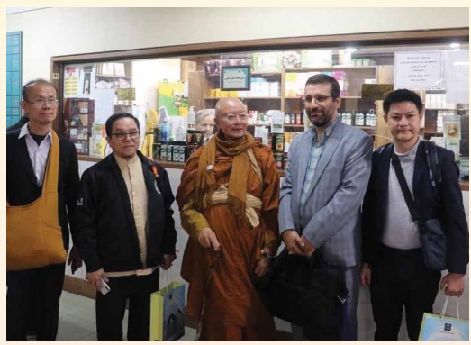
คณะแพทย์แผนโบราณ University of Tehran