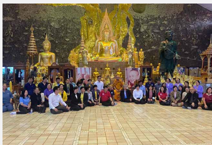
เครือข่ายผู้อำนวยการโรงพยาบาลสกลนครและโรงพยาบาลต่างๆ ร่วมศึกษาดูงาน สถานชีวภิบาลต้นแบบ ณ อโรคยศาล วัดคำประมง จังหวัดสกลนคร ระหว่าง ๑๐-๑๒ มิถุนายน ๒๕๖๗