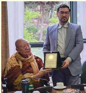
Prof.Dr.อารอห์ซออี Imam Sadiq University มอบของที่ระลึกแด่หลวงตา