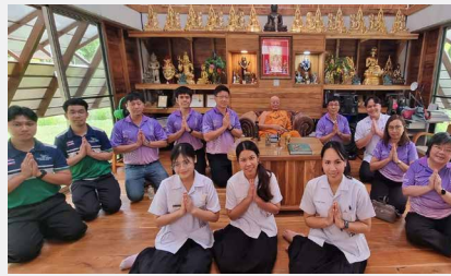
คณะผู้บริหารศูนย์วิจัยความเป็นเลิศยาสมุนไพรและเทคโนโลยีทางเภสัชกรรม คณะเภสัชกรรมมหาวิทยาลัยสงขลานครินทร์ ศึกษาดูงานสถานชีวภิบาล อโรคยศาล วัดคำประมง จังหวัดสกลนคร เมื่อ ๒๓ พฤษภาคม ๒๕๖๗