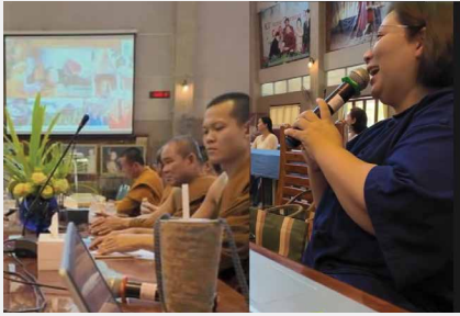
คณะแพทย์แผนไทยและแพทย์ทางเลือกมหาวิทยาลัยราชภัฏอุบลราชธานีนำคณะพระคิลานุปัฏฐากจากจังหวัดอุบลราชธานี ศึกษาดูงานสถานชีวภิบาล ณ อโรคยศาล วัดคำประมง จังหวัดสกลนคร เมื่อ ๑๙ พฤษภาคม ๒๕๖๗