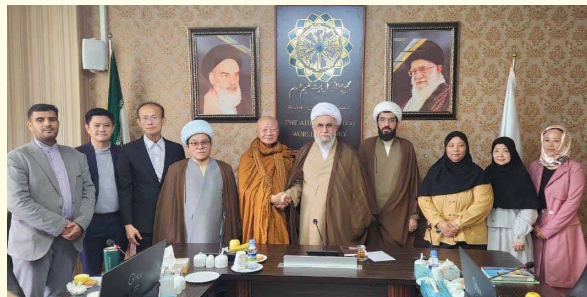
องคมนตรี รอมอดอล ให้การต้อนรับหลวงตาและคณะ

ในการศึกษาดูงาน ณ ประเทศอิหร่านครั้งนี้ หลวงตาและทีมงานมีความภูมิใจและประทับใจที่ได้มีโอกาสเผยแพร่การรักษาโรคมะเร็ง ตามแนวอโรคยาศาล วัดคำประมง และการแพทย์แผนไทยและการแพทย์ทางเลือก แก่บุคลากรสำคัญของประเทศอิหร่าน ตลอดจนการแลกเปลี่ยนความรู้ทางศาสนา การแพทย์แผนโบราณ พร้อมทั้งการได้เยี่ยมชมสถานที่สำคัญของประเทศอิหร่านซึ่งมีอารยธรรมอันเก่าแก่มาหลายร้อยปี และก่อนที่คณะของหลวงตาจะเดินทางกลับ องคมนตรี รอมอดอล ยังได้พูดถึงหลักปรัชญาอันดีงามได้แก่ ศาสนาทุกศาสนามุ่งเน้นให้ทุกคนเป็นคนดี และพูดถึงเรื่องพลังจิตและสมาธิเพื่อความสงบ สันติภาพของโลก ขอให้โลกอยู่กันด้วยความรักด้วยการให้อภัยกัน สวดมนต์ภาวนากัน พร้อมทั้งกล่าวว่าการมาเยือนของคณะหลวงตาในครั้งนี้ถือว่าเป็นการเชื่อมความสัมพันธ์ระหว่าง ๒ ศาสนาให้แน่นแฟ้นและร่วมแรงร่วมใจกันนำความสุข ความสงบ ความเจริญแก่มวลมนุษยชาติ โดยไม่เลือกชนชั้น เชื้อชาติและศาสนา และขอให้คณะของหลวงตาคลับมาเยี่ยมอิหร่านอีกครั้ง หลวงตาและคณะรู้สึกสัมผัสได้ถึงความรัก ความเมตตาของ องคมนตรี รอมอดอล อย่างยิ่ง