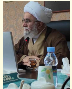
องคมนตรี รอมอดอล